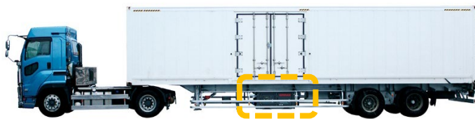
リーファーコンテナ